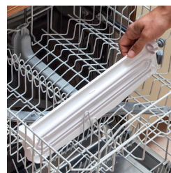
Vaschetta lavabile in lavastoviglie Tray washable in dishwasher